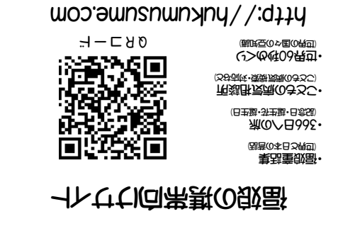
福娘童話集 世界の童話

「お花は、お供えするのには、お花の命を大切にしたい。」 「お花は、お供えするのには、お花の命を大切にしたい。」 「お花は、お供えするのには、お花の命を大切にしたい。」 「お花は、お供えするのには、お花の命を大切にしたい。」 「お花は、お供えするのには、お花の命を大切にしたい。」